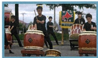
※写真は、去年の夏祭りの様子 (左:池田高校吹奏楽部「ダンプレ」。右:勇壮な音更駒太鼓。)